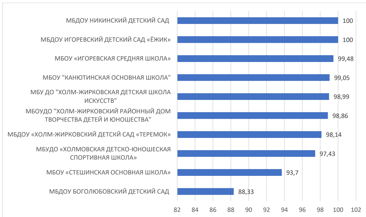
Рисунок 5 – Рейтинг организаций по критерию «Удовлетворенность условиями осуществления образовательной деятельности организаций»

По пятому критерию «Удовлетворенность условиями осуществления образовательной деятельности организаций» максимальный результат 100 баллов набрали МБДОУ НИКИНСКИЙ ДЕТСКИЙ САД и МБДОУ ИГОРЕВСКИЙ ДЕТСКИЙ САД «ЁЖИК».