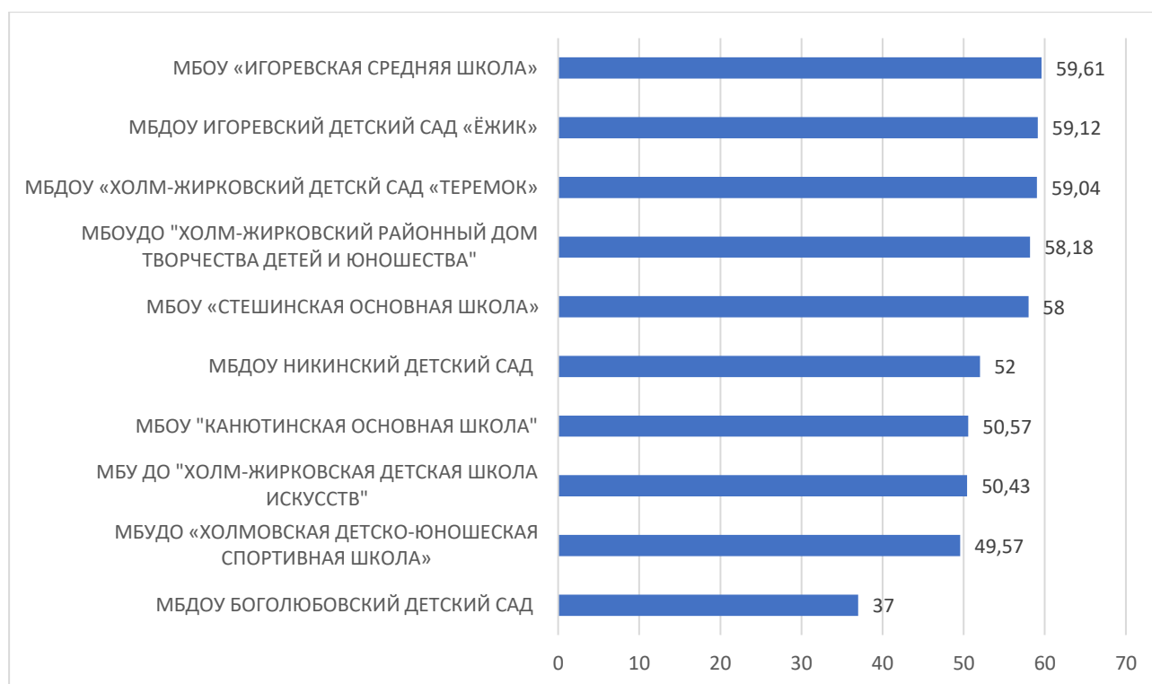
Рисунок 3 – Рейтинг организаций по критерию «Доступность образовательной деятельности для инвалидов»

По третьему критерию «Доступность образовательной деятельности для инвалидов» максимальный результат 59,61 баллов набрало МБОУ «ИГОРЕВСКАЯ СРЕДНЯЯ ШКОЛА».