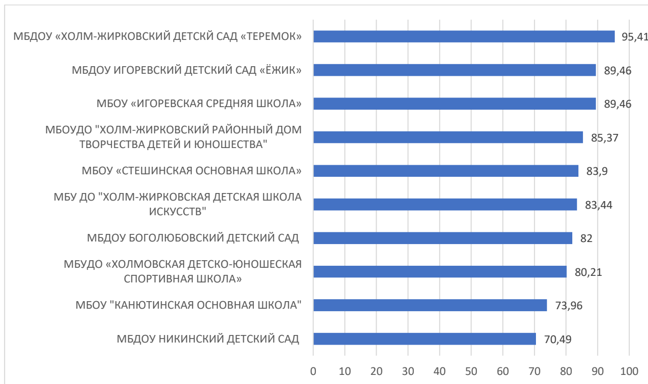
Рисунок 1 – Рейтинг организаций по критерию «Открытость и доступность информации об организации, осуществляющей образовательную деятельность»

По первому критерию «Открытость и доступность информации об образовательной организации» максимальный результат 95,41 балла набрало МБДОУ «ХОЛМ-ЖИРКОВСКИЙ ДЕТСКИЙ САД «ТЕРЕМОК».