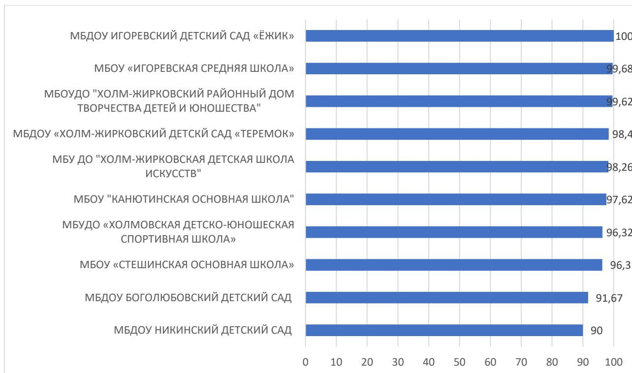
Рисунок 2 – Рейтинг организаций по критерию «Комфортность условий, в которых осуществляется образовательная деятельность»

По второму критерию «Комфортность условий, в которых осуществляется образовательная деятельность» максимальный результат 100 баллов набрало МБДОУ ИГОРЕВСКИЙ ДЕТСКИЙ САД «ЁЖИК».