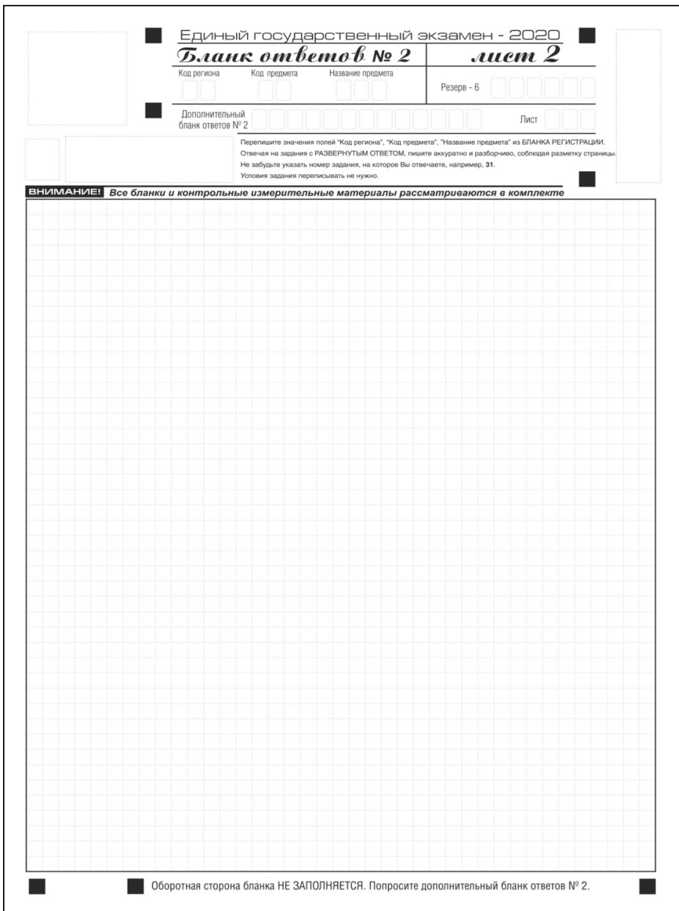
Рис. 11. Бланк ответов № 2 (лист 2)